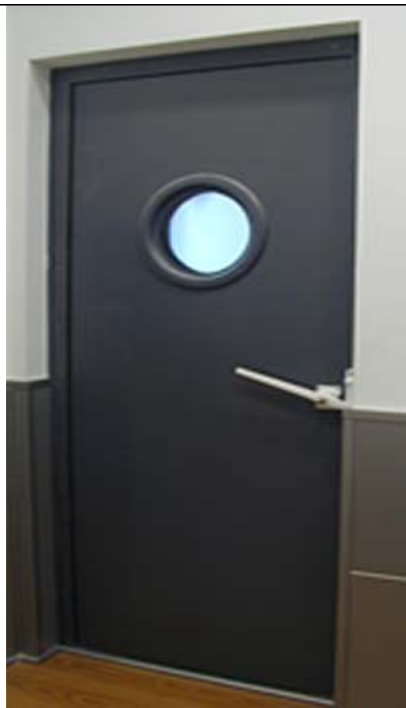
TERMINACION EN CHAPA