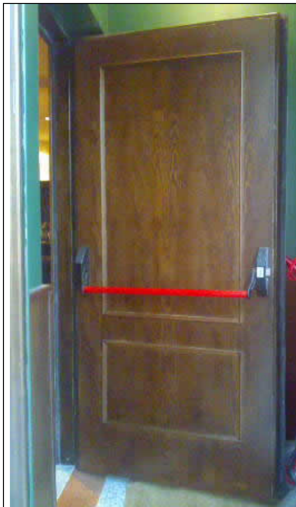
TERMINACION CHAPEADA EN MADERA