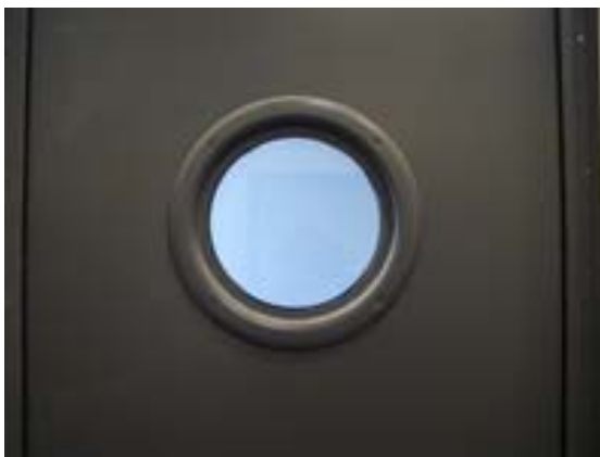
VISOR ACÚSTICO (OJO DE BUEY) 300 mm Ø