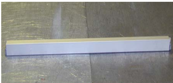
BURLETE AUTOMÁTICO DE SUELO