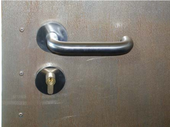
MANILLA DE RODAMIENTOS Y CERRADURA