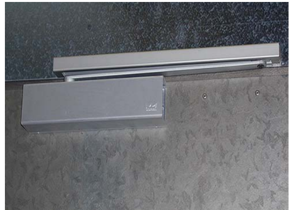
MUELLE DE CIERRE