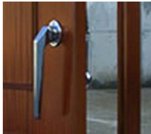
CIERRE DE PRESIÓN